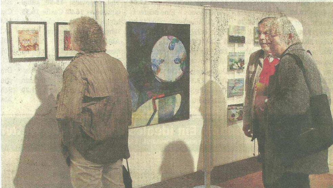
Die Besucher schauen sich ganz genau die neue Ausstellung der Künstlervereinigung Pupille an.